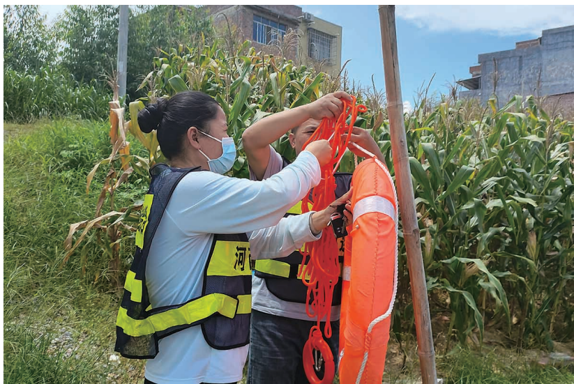
▲长梅社区工作人员在辖区水域放置救生设备。

晚刊(记者 黄小清 谢铭文/图)暑假来临,溺水事故进入高发期。如何让孩子们度过一个平安快乐的暑假,避免发生溺水意外?近日,兴宾区多个社区结合实际,多措并举加强暑期防溺水工作。