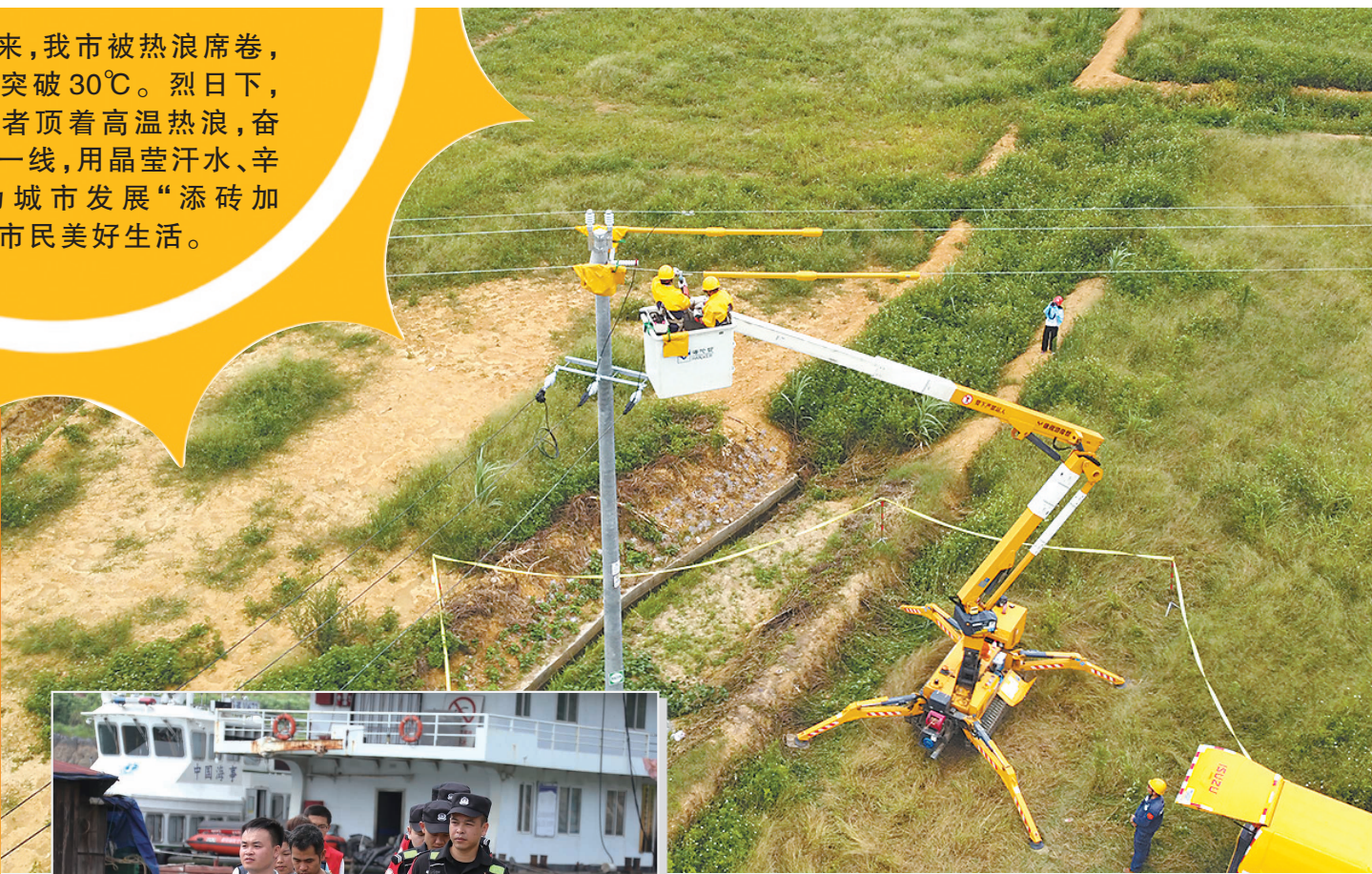
▲电力作业人员乘坐专项绝缘带电工作车开展作业。