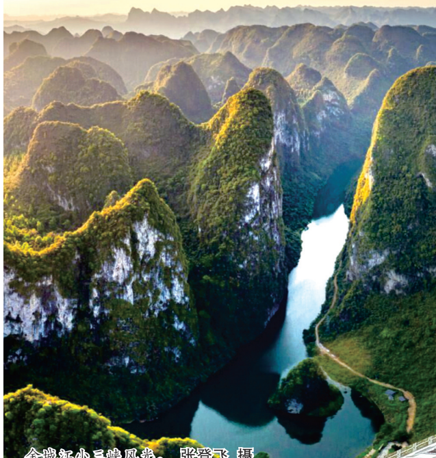
金城江小三峡风光。