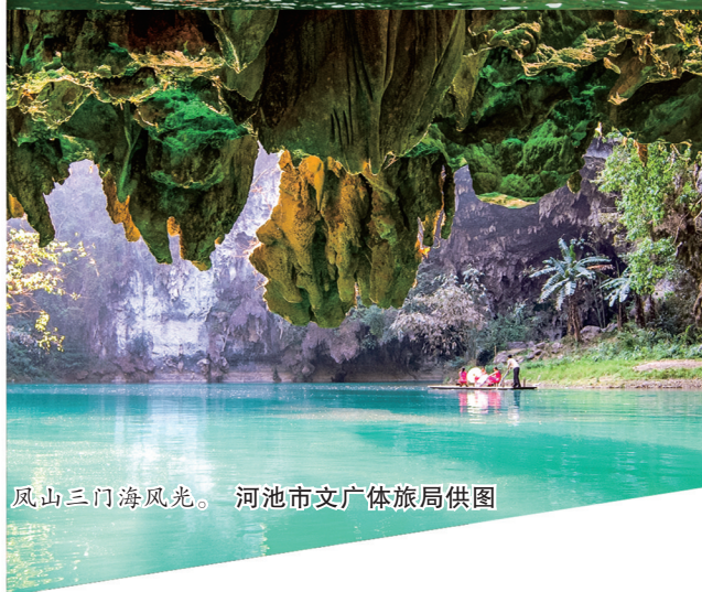
凤山三门海风光。