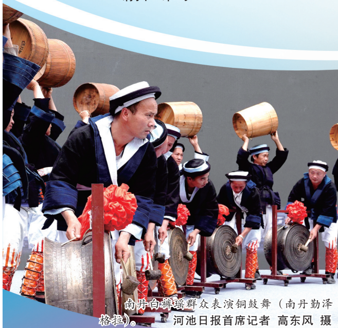
南丹白裤瑶群众表演铜鼓舞(南丹勤泽格摄)。河池日报首席记者 高东风 摄