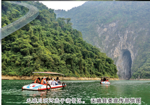
天峨川洞河庵寺湖景区。