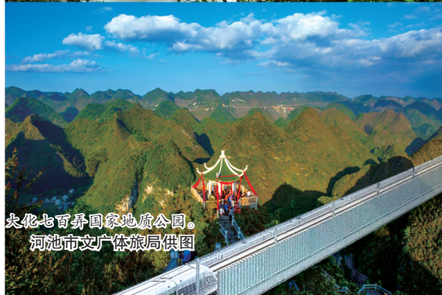
大化七百弄国家地质公园。