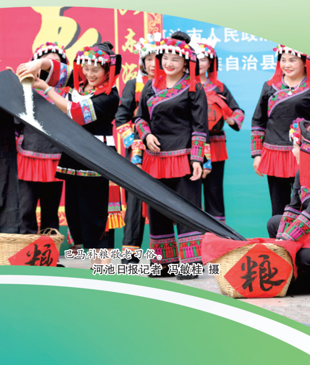
巴马补粮敬老习俗。