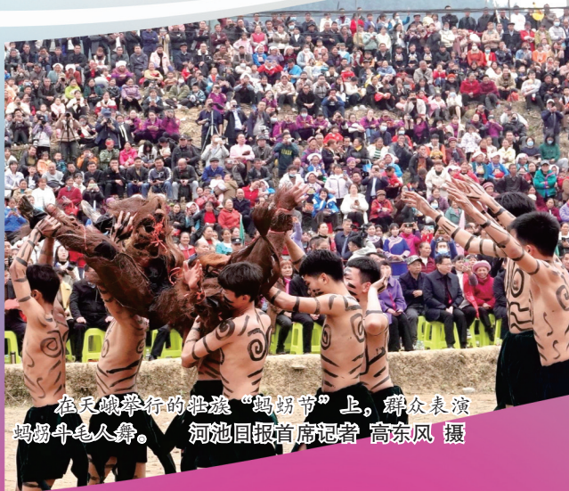
在天峨举行的壮族“蚂拐节”上,群众表演蚂拐十七人舞。河池日报首席记者 高东风 摄