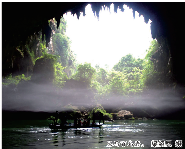
巴马百鸟岩。