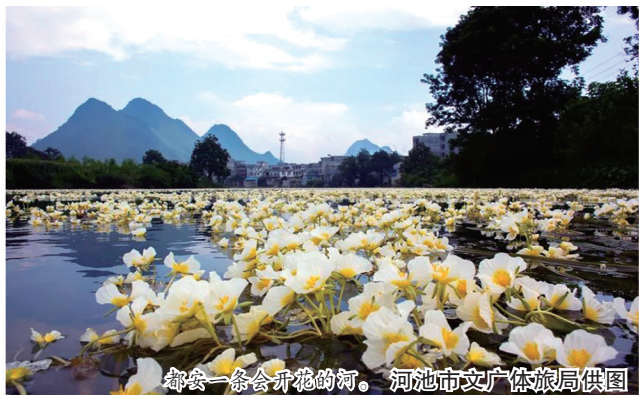
起会一条会开花的河。