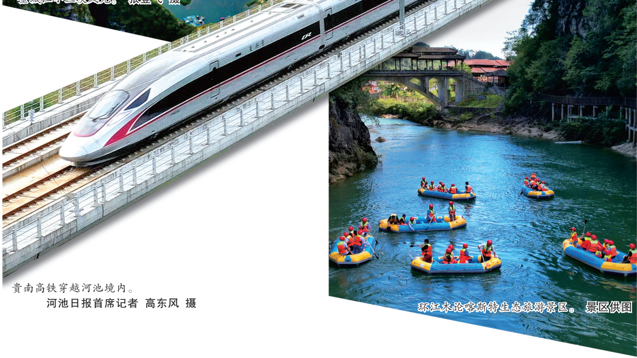
贵南高铁穿越河池境内。