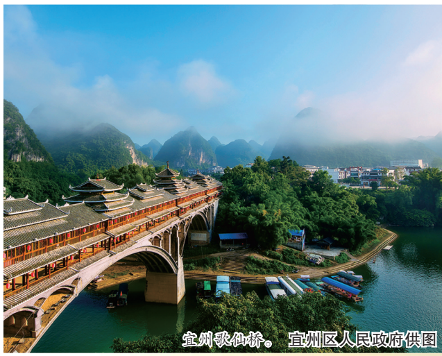
宜州歌仙桥。

本专版在(来宾日报)(北海日报)(茂名日报)(西江日报)(云浮日报)(梧州日报)(玉林日报)(阳江日报)(左江日报)(贺州日报)(贵港日报)(海口日报)(防城港日报)(河池日报)同步刊发