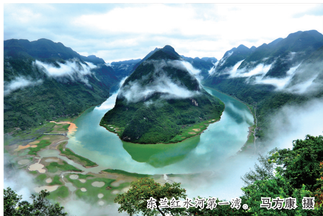
东兰红水河第一湾。