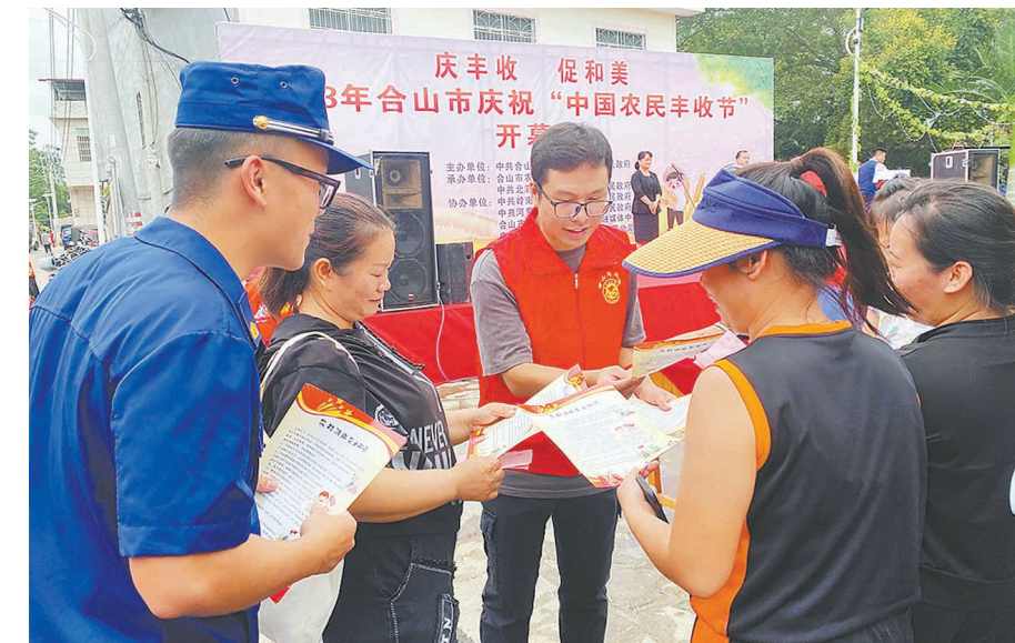
▲9月19日,合山市庆祝“中国农民丰收节”开幕式在北泗镇龙王村举行,合山市消防救援大队以此为契机,加大消防宣传力度,增强群众消防安全意识,为秋季农村火灾形势持续平稳奠定良好基础。图为志愿者向群众宣传农村消防安全知识。