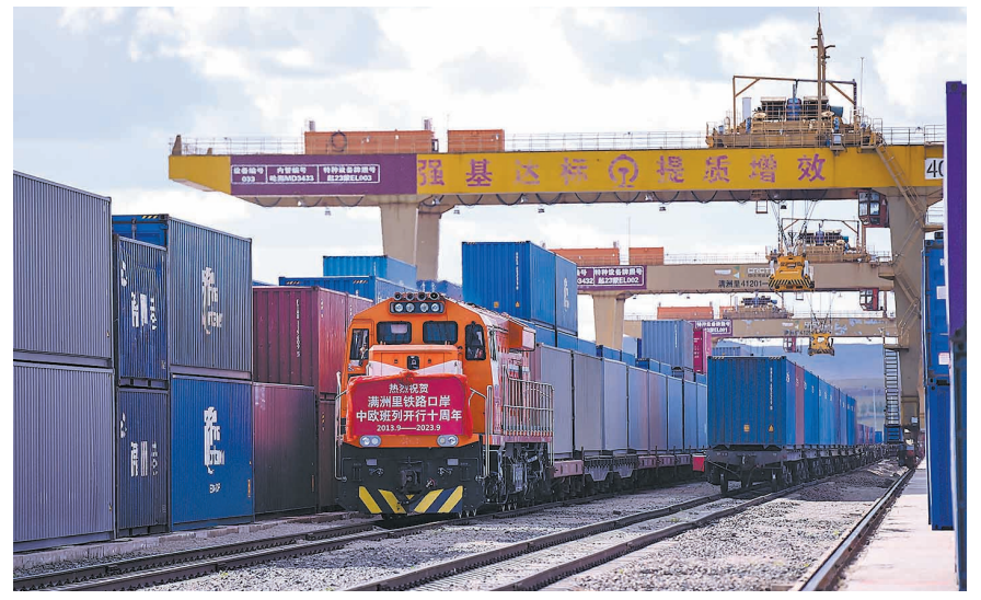
▲这是9月20日拍摄的满洲里站货运车集装场,换装完毕的一列中欧班列。作为我国向北开放的“桥头堡”、中欧班列“东通道”的重要口岸,满洲里铁路口岸不断加大中欧班列通道能力建设,进一步提升运输效率和品质。10年来,满洲里铁路口岸中欧班列通行量实现连年增长,助力满洲里加速向北开放。截至今年8月底,经由满洲里铁路口岸进出境的中欧班列累计通行量达24316列、231万标箱。