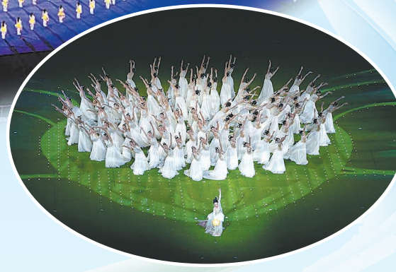
▲10月8日,演员在闭幕式上表演。