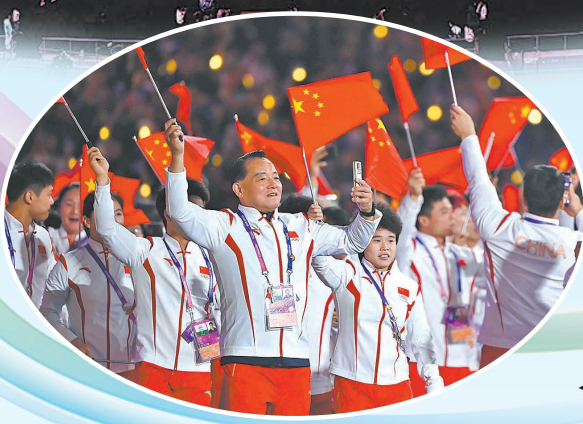
▲10月8日,中国运动员在闭幕式上。