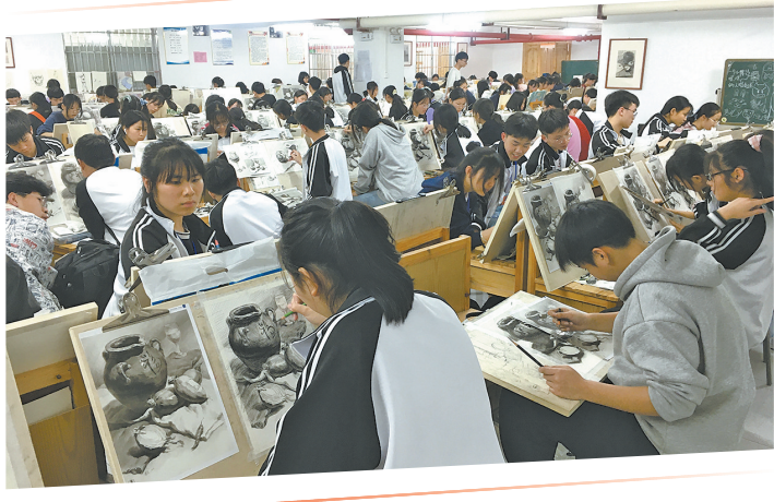
▲美术特长生认真作画。