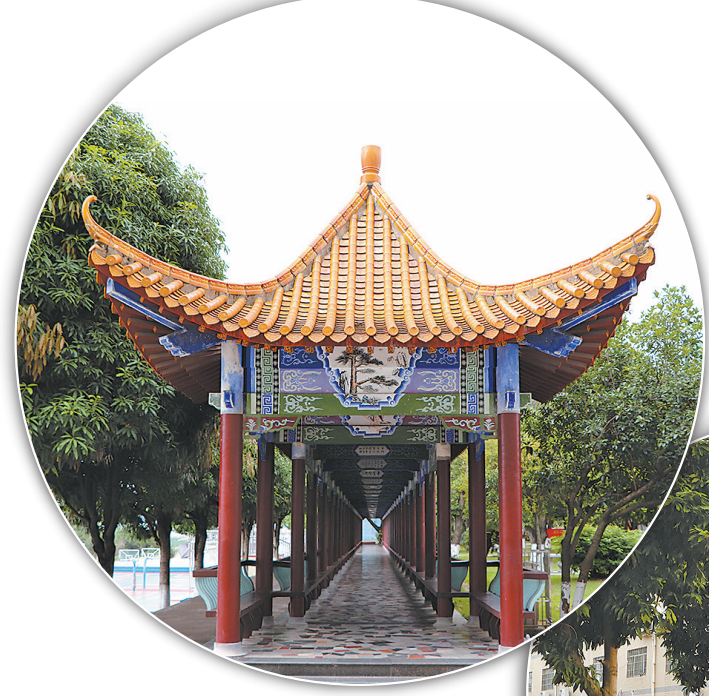
▲具有民族特色的状元廊。