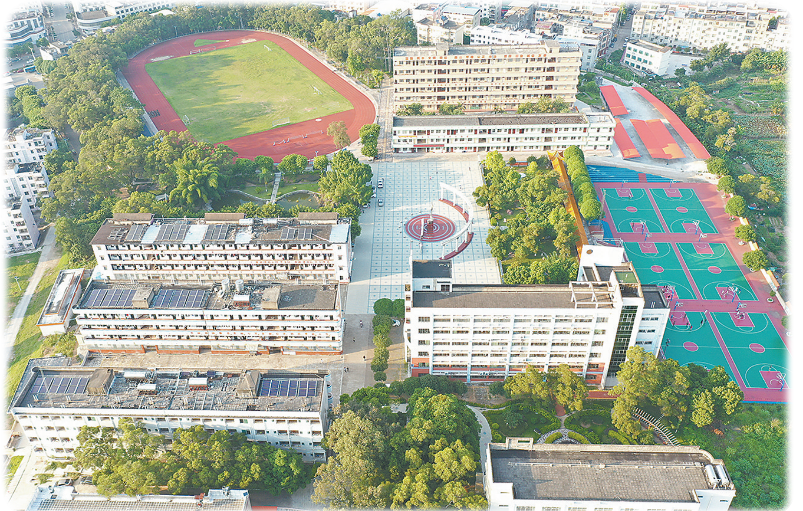
▶环境优美、设备设施齐全的校园全景(航拍)。