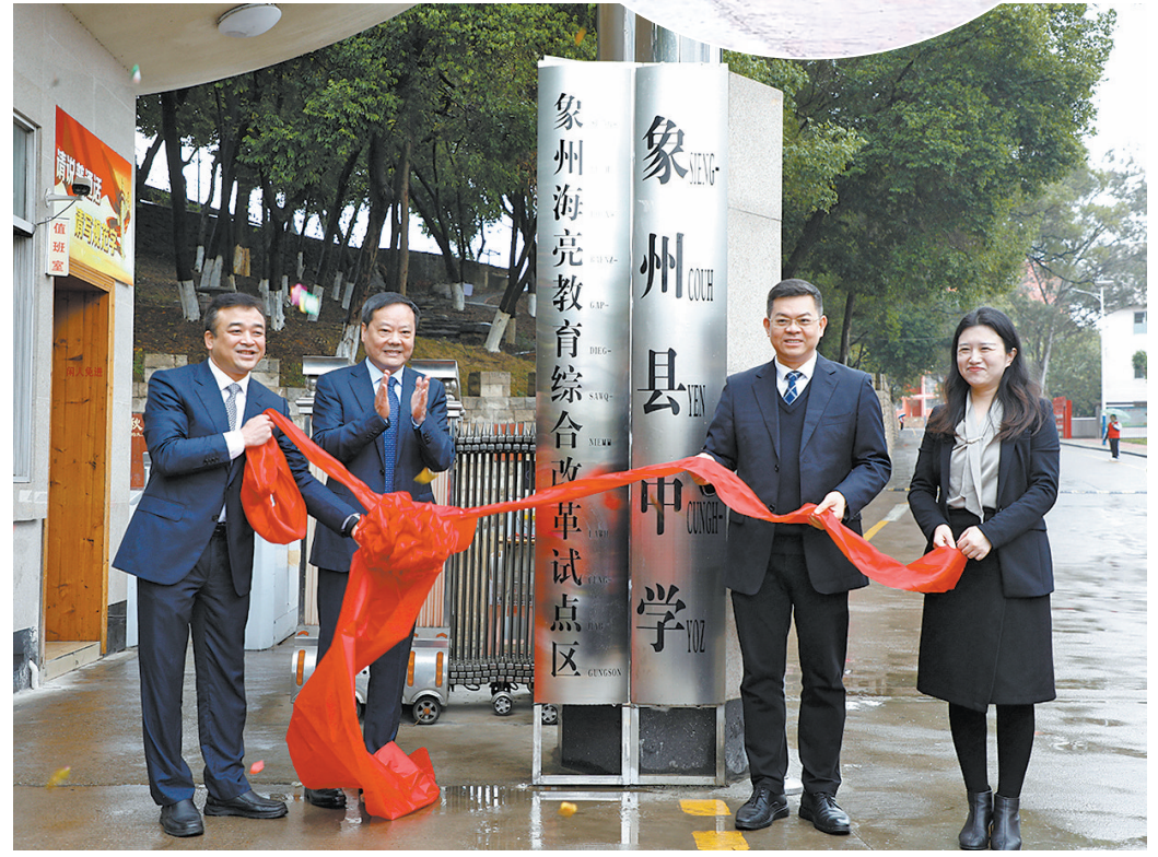
▼象州海亮教育综合改革试点区揭牌仪式。