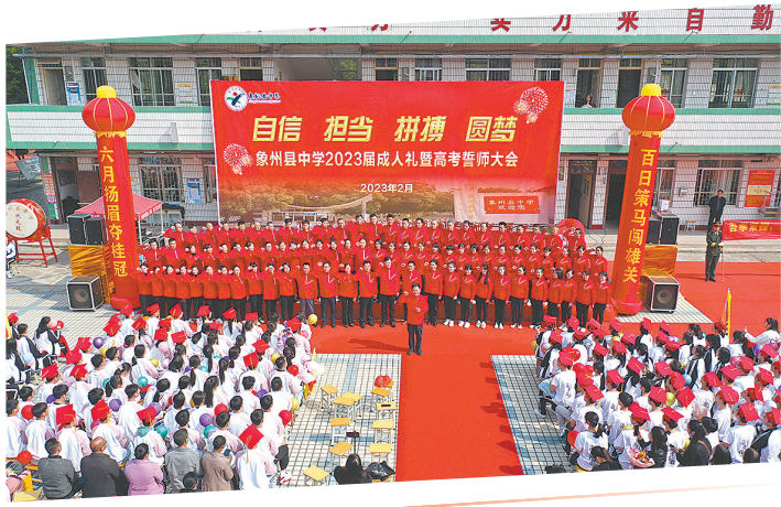
▲2018届高三高考誓师大会。