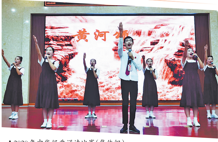
▲2020年中华经典诵读比赛(集体组)。