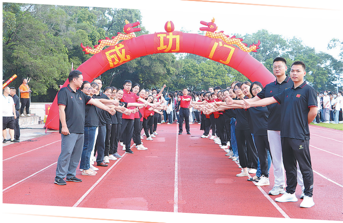
▲2023年高考出征壮行大会。