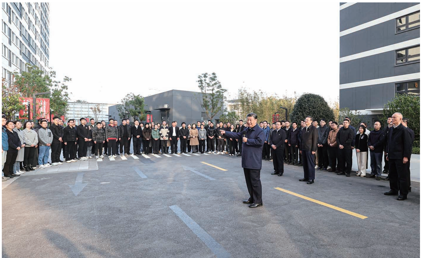
▲11月28日至12月2日,中共中央总书记、国家主席、中央军委主席习近平在上海考察。这是11月28日下午,习近平在上海期货交易所考察。