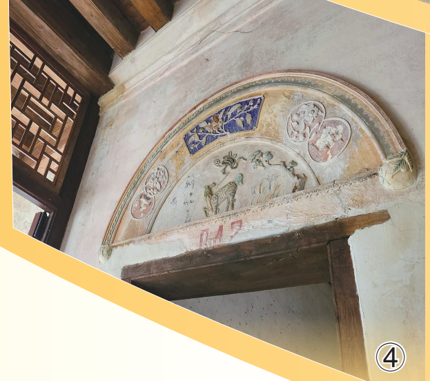
④ 墙壁上的飞鸟走兽等浮雕栩栩如生。