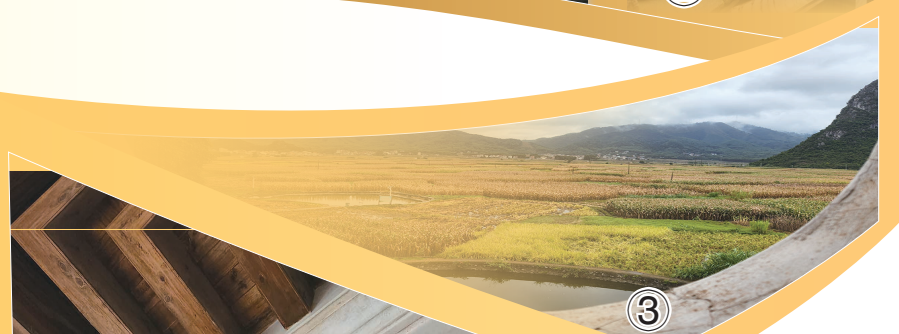
③ 从庄园远眺，大片稻田相拥相簇。