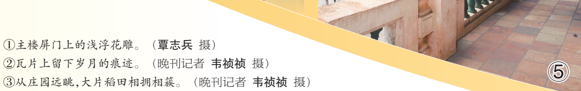
⑤ 楼台采用拱门和柱廊等建筑元素，远处即是广阔的田野。