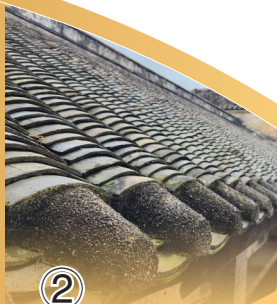
② 瓦片上留下岁月的痕迹。