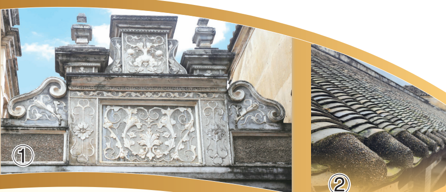
① 主楼屏门上的浅浮雕雕。

漫步武宣，打动人的不仅有高楼大厦，还有各具特色的古建筑。郭氏庄园是武宣县现存修缮完整的封建地主府第之一，是历史长河的缩影，承载着先人的智慧与勤劳，浸润着后人的奋进与成功。走进名人故居，寻着历史足迹感受昔日风云变幻，聆听岁月回声，或从中读懂它的历史和美。修葺庄园，使之重新“回归”，再续当地历史文脉，不仅为我们再现了前人智慧和创造力，也为世人留下珍贵的历史文化遗产。