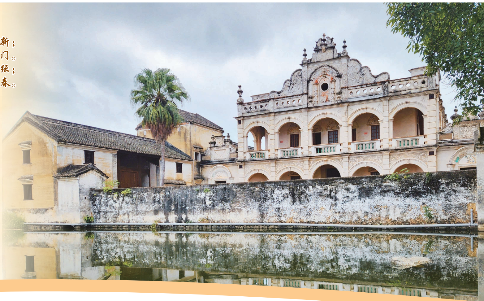
▲修复后的郭氏庄园庄严肃穆。

置身庄园，楼前庭院，椰树摇曳；巷间古井，水清蕨绿；门前榕树，小鸟啾啾；院前池塘，麻鸭浮动，蛙声吟鸣，使人沦陷在这素色温柔的环境中。