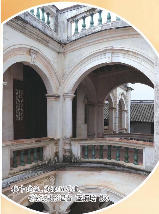
楼中建筑，高深而厚重。

百年古宅沐风尘，今岁复原处处新； 故人已随岁月去，空留老屋掩朱门。 一代将才藏铁骨，是非功过说纷纭； 江山纵是无情物，写尽人间浩荡春。