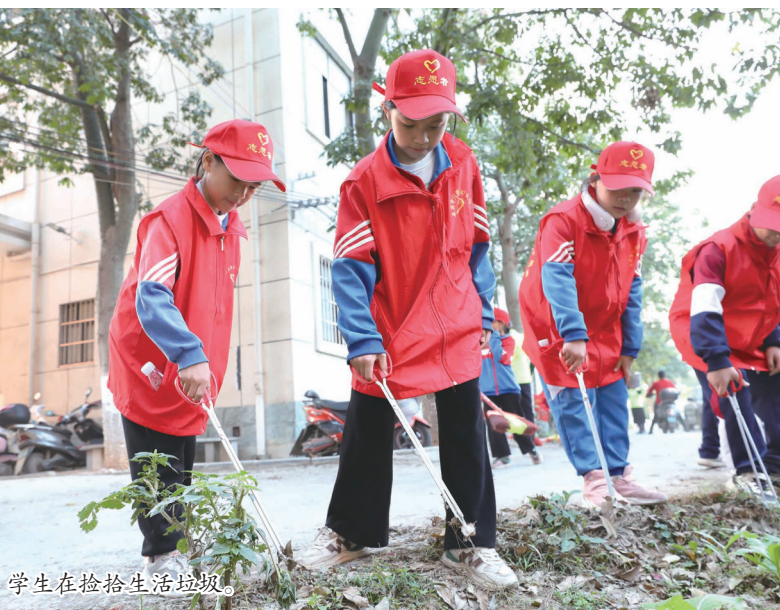
学生在捡拾生活垃圾。

本报讯(记者 刘维 见习记者 王雅茹 通讯员 方雨文/图)“电池属于有害垃圾,水果皮属于厨余垃圾……”12月13日,兴宾区河西街道爱宾社区开展“环保妈妈”志愿服务活动,增强青少年的环保意识,培养爱护环境、保护环境的良好习惯。