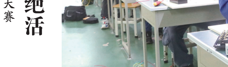
▲维修电工比赛现场。

近年来,全市各级工会广泛深入开展以岗位练兵、生产竞赛、发明创造、技能比赛等为主要内容的技能竞赛。今年以来,已开展劳动和技能竞赛46场,参加职工5000多人次;我市代表队参加自治区级比赛,多个赛项获得优异成绩。