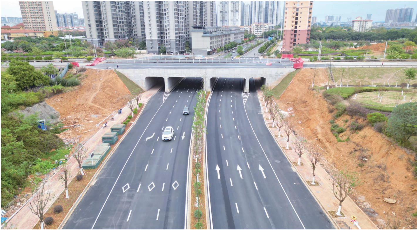
▶下穿通道全线通车,路面宽敞整洁。

据了解,滨江北路下穿通道工程全长150米,采用四孔箱涵形式建设,今年10月12日临时通车,12月2日全线通车。“道路打通后,进一步完善了华侨区与城北区东西向路网系统,全面提升和改善周边区域的交通便利度,有效缓解滨江小学师生、周边群众出行拥堵问题。”市住建局副局长韦伦说。