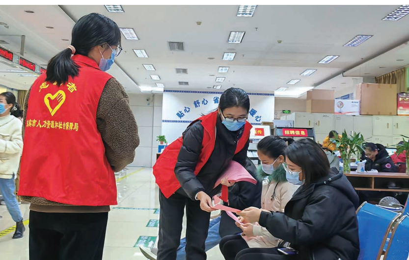
▲为提高经济普查工作的知晓度,动员全社会积极参与调查,12月26日,市人社局在政务服务中心人社中心组织志愿者,向办事群众宣传全国第五次经济普查工作,营造理解普查、重视普查、支持普查的良好氛围。