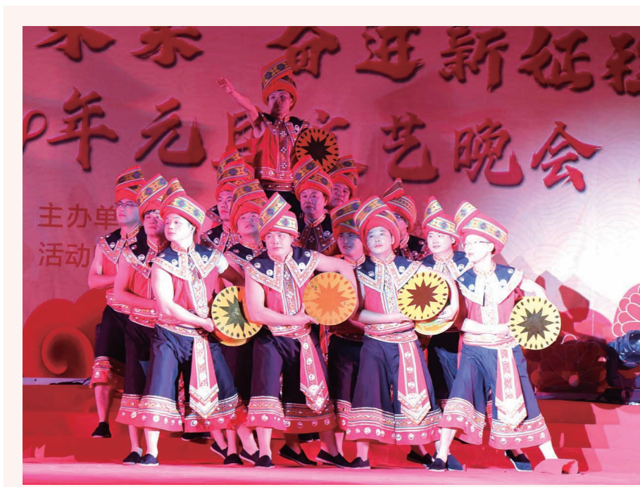
▲12月26日,来宾职业教育中心学校举办庆祝2024年元旦文艺晚会,师生齐聚一堂,歌声悠扬,舞姿翩翩。晚会精彩纷呈,学生们通过歌舞、戏剧等多种艺术形式,展现出青春的活力和无限才华,并送上节日的美好祝福,赢得现场观众阵阵掌声。

今年初,驻柳管理处与各社区沟通,对大院建筑物、配套设施等情况开展前期调研工作,并组织社区、业委会、设计施工单位等召开座谈会,听取各方对大院老旧小区改造的意见建议。经过多方协调配合,目前一大院部分墙体拆建、道路拓宽、路灯安装等配套基础工程已完成70%,二大院26座居民楼楼顶防水隔热层改建等工程加快推进,三大大院已完成施工公示,力争早日落地开工。(张威)