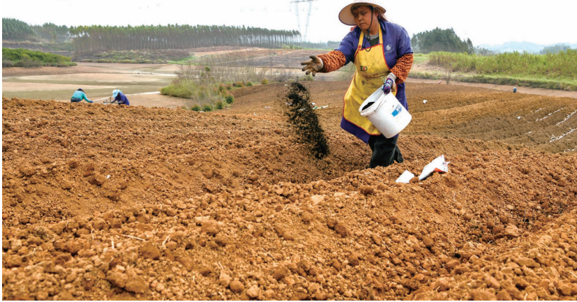
▲城厢镇群众在地里施肥。

抢农时、备农资、优服务……良江镇及时组织包村领导、驻村干部深入田间地头,产业基地,详细了解春耕备耕物资保障供应、农资运输配送等情况,为春耕备耕农业生产提供坚强保障。积极组织农技干部当好“宣传员”“协调员”,加强技术指导,耐心指导村