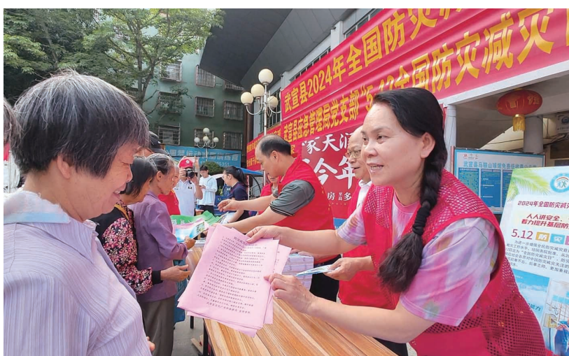
▲工作人员向群众宣传防灾避险知识。