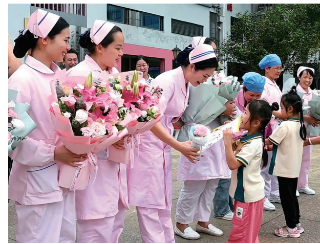
►今年5月12日是第113个国际护士节,也是母亲节,武宣县新幼幼儿园的小朋友亲手绘制礼物并送给护士们,以此表达敬意和感谢。

硬、作风优良、敢于创新、服务高效的不动产登记队伍,团队立足岗位,以巧干实干敢干的精神,不断优化营商环境,让不动产登记团队向更高“快车道”前进,更好地服务企业、服务群众。2015年,蒙伟雁被自治区人社厅、自治区自然资源厅授予个人二等功;2019年获评武宣县首批创新型干部,2020年获评武宣县“敬业奉献道德模范”、“来宾市三八红旗手”,2021年荣获“绿水仙城”建设先进个人、“来宾提名最美职工”,2022年获自治区自然资源厅授予“清廉广西自然资源建设工作表现突出个人”。 谈及获评首届全国“最美不动产登记人”,蒙伟雁认为,只有把不动产登记这件事办好,让群众放心、让企业安心就是最大的欣慰。今后将一如既往带领不动产登记团队,不忘初心,立足岗位,全面推动不动产登记工作再上新台阶。