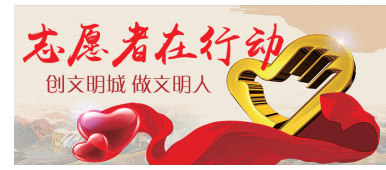
创文明城 做文明人