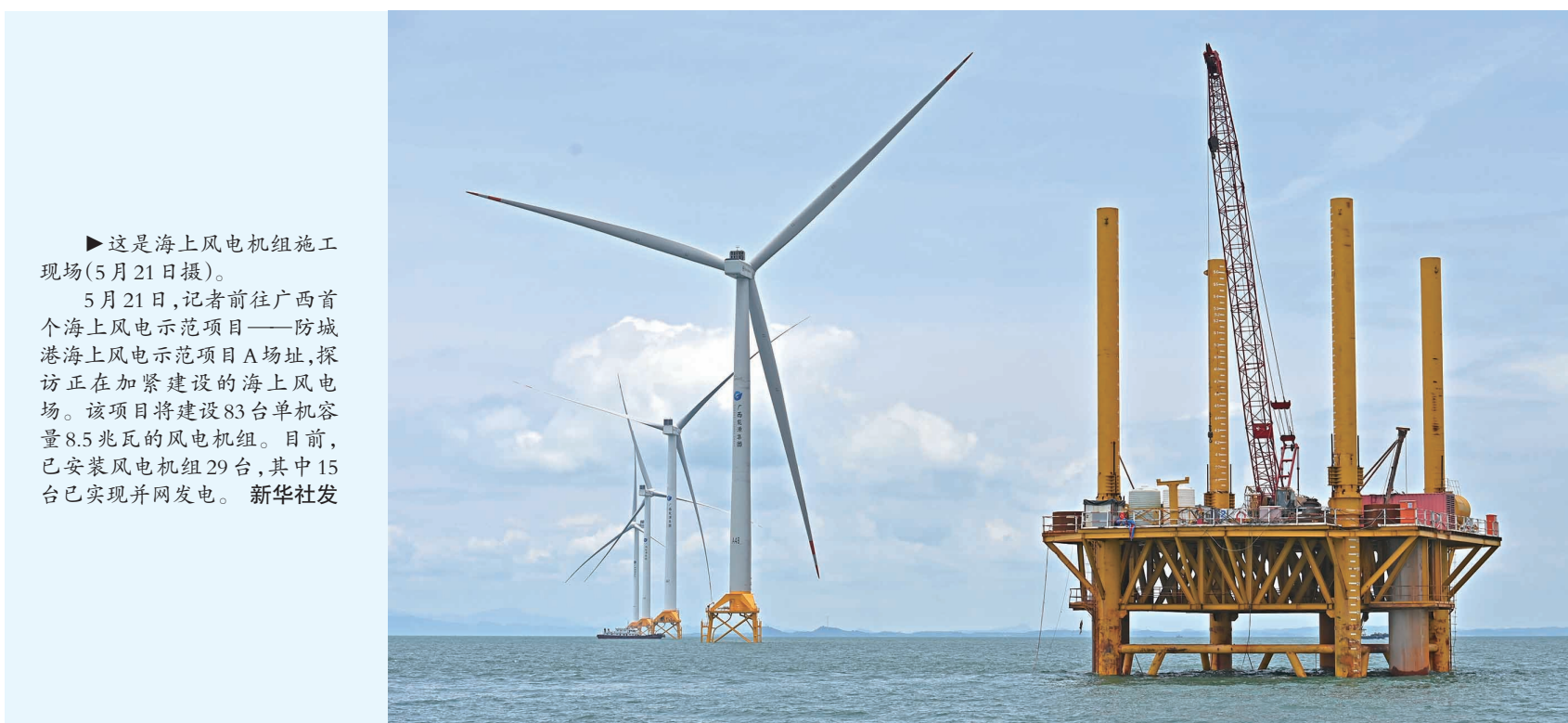
►这是海上风电机组施工现场(5月21日摄)。

第二十二届文博会共组织6015家政府组团、文化机构和企业线上线下参展;全国31个省、自治区、直辖市及港澳台地区全部参展;来自60个国家和地区的300多家海外展商线上线下参展;3万余名海外专业观众线上线下参会。展会将展出文化产品超过12万件,4000多个文化产业投融资项目在现场进行展示与交易。