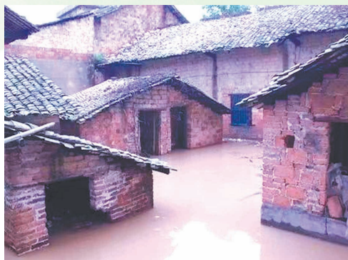
▲村里历年被洪水浸泡的房屋。

四安村是武宣县桐岭镇辖区村民委之一,位于县城南部、黔江河畔,距县城15公里,辖上安、中安、下安、连安四个自然屯,全村有554户2070人,原有耕地5700多亩。穿村而过的布赖河,河道曲折蜿蜒,每年汛期,布赖河上游的河水与黔江河上涨的洪水在四安村交汇,造成村庄内涝,常常三五天才退去。期间,村民的房屋、田地遭受浸泡,水稻几乎绝收。