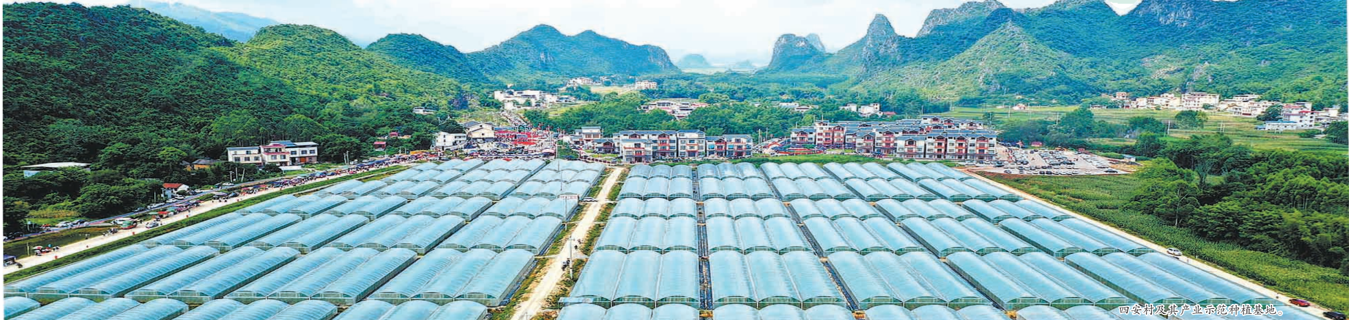
四安村及其产业示范种植基地。