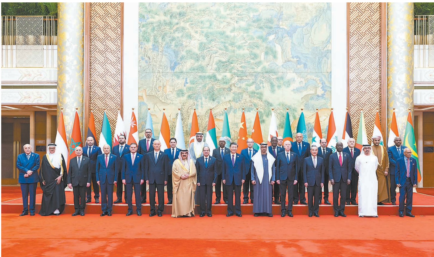
▲5月30日上午，国家主席习近平在北京钓鱼台国宾馆出席中阿合作论坛第十届部长级会议开幕式并发表主旨讲话。