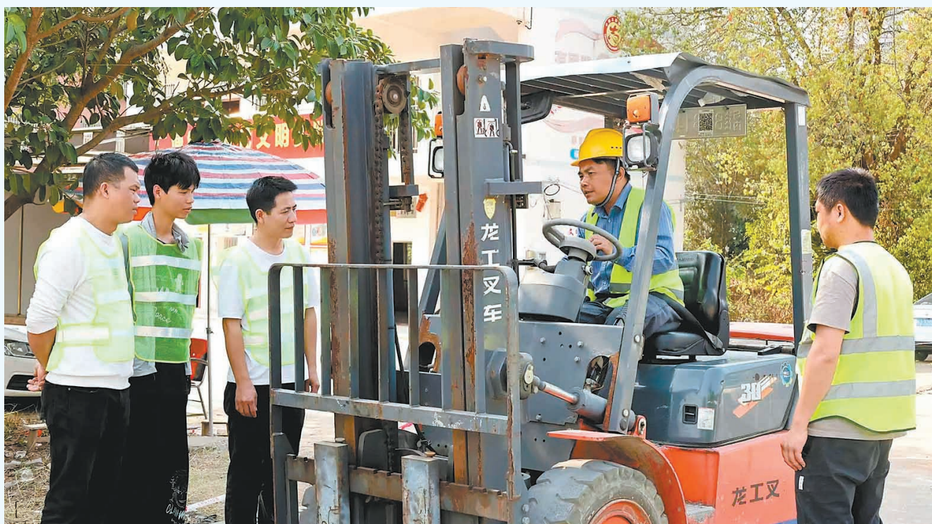
▲二塘镇以“授人以渔,赋能乡村振兴”为目标,将职业技能培训打造成群众广泛认可的“民生工程”和产业发展的“活力引擎”,确保更多群众实现“一技在手,就业不愁”。图为3月24日,该镇组织的叉车操作培训,培训老师正在进行现场教学。