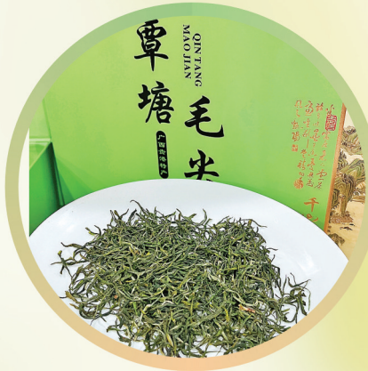
“龙湾鼎”牌覃塘毛尖

富含优质营养，每100g含4.0g高蛋白，远超欧盟标准。采用“生水牛乳+生牛乳”，低脂肪含量，更易消化吸收。经巴氏杀菌工艺，在灭活有害菌的同时锁住天然活性营养，口感清甜醇厚，奶香浓郁纯正。 生产企业：广西农垦西江乳业有限公司