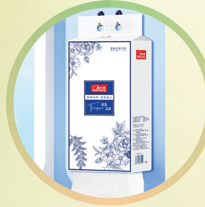
趣本熊青花系列面巾纸

采用九铬十八钢等高硬度复合钢打造，强度高、硬度强，锋利耐用。作为广西自治区非遗产品，传承匠心工艺，为厨房烹饪助力。 生产企业：平南具上渡雅埠村五金销售有限公司