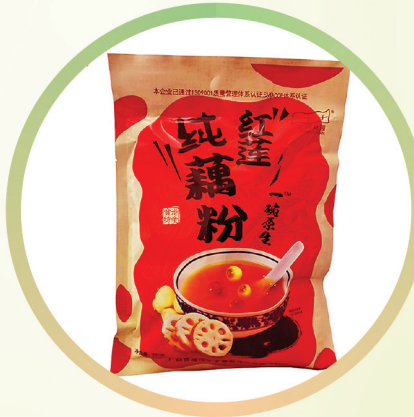
“金田葛园”红莲藕粉

配料干净，采用产地直销的新鲜贡梨，精选薄荷、甘草、高良姜、胖大海、罗汉果、金银花等中草药，经过上百次的试验研发而成，产品圆润饱满，色泽金黄，口感软硬适中，甜润清凉，适合全年龄段的人群食用。独立包装，安全便携。 生产企业：广西糖业集团西江制糖有限公司