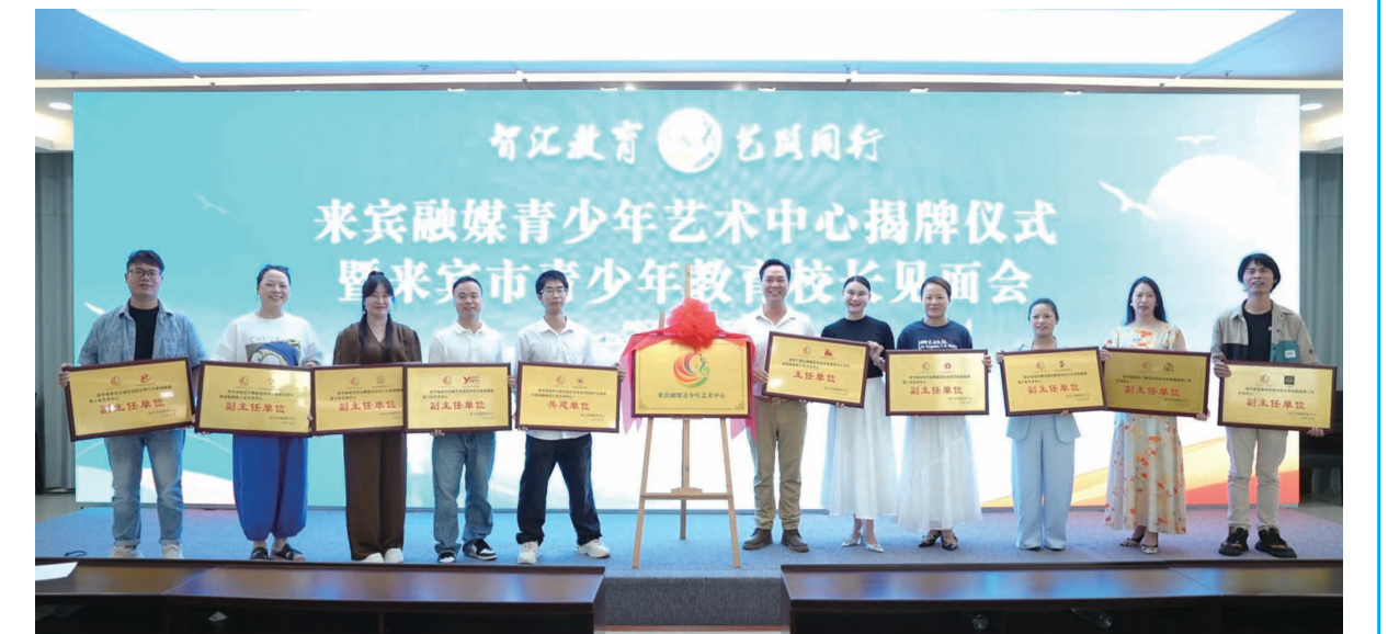
▲“来宾融媒青少年艺术中心”共建单位、主任单位、副主任单位合影。

近年来，市融媒体中心不断拓宽青少年教育的服务范畴，充分利用平台资源优势，为我市青少年儿童提供了一个展示自我的平台。目前，中心整合了全市20多家优质艺术培训机构，依托强大的全媒体传播矩阵，全力打造一个专业的艺术人才孵化平台，一套完善的线上线下教学体系，一条完整的文化产业链条“三个一”工程。据悉，今年还将陆续开展“小