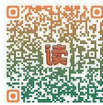
扫码聆听更多美文。

我反对那种“只看果实而不问耕耘”的定论，如果拿“天赋”来慢慢拆解，它一定有我们可以学习的地方。只要找到能学习之处而奋起直追，我们多少也能循着“天赋”的光环，获得一些裨益。若把学习认定为终身之事，光依靠天赋或吃天赋的老本，终究难以长久。相比之下，发掘学问乐趣、增进对知识的情怀和培养不急不躁的学习耐力，来得更为靠谱。这就像一条狗远远看见主人就兴高采烈地冲上来，欢欣无比地围着主人打转亲昵。这个时候，主人哪里在乎这条狗是聪明还是愚笨，只为它忠贞不渝的情怀而感动。同理，我们对待知识，如若真有狗对待主人那般的热情或情怀，那不论我们是“笨狗”还是“聪明狗”，我们都会得到知识给予的回馈。而这种回馈，与“读书天赋”并无多大关系，但你硬要理解成是天赋，那至少应该是另外一种天赋。