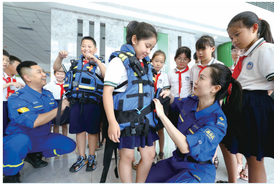
▲7月3日，山东省青岛市即墨区蓝天救援队志愿者为即墨区第三实验小学惠欣路校区的学生讲解救生衣的使用方法。暑期来临，许多青年志愿者投入志愿服务活动，为社会贡献力量。