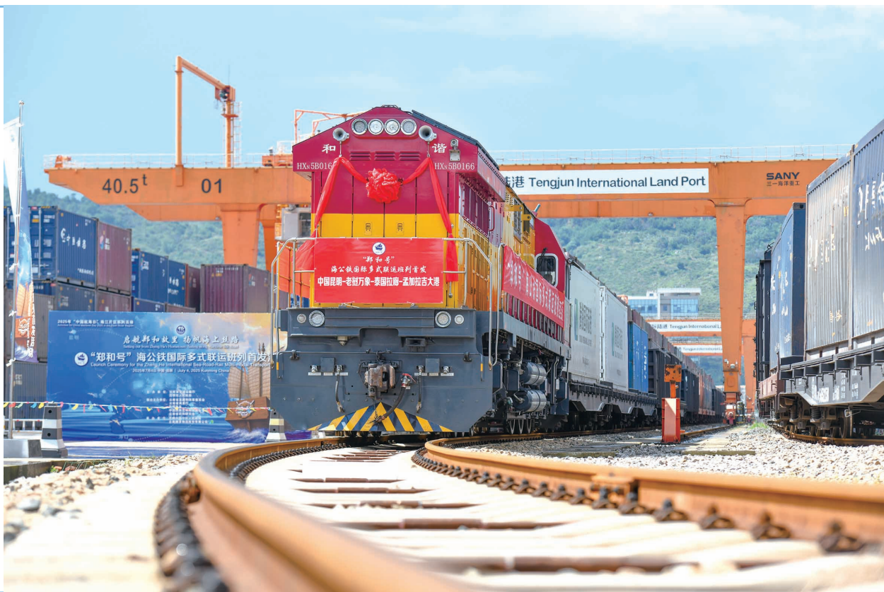
▲“郑和号”海公铁国际多式联运班列从昆明首发

7月4日，“郑和号”海公铁国际多式联运班列首发列车在昆明市腾俊国际陆港公铁联运中心等候发车。