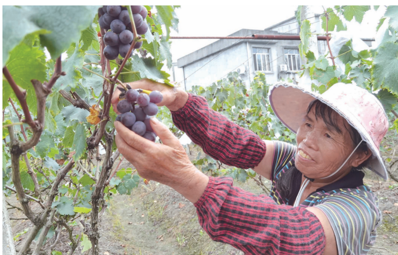
▲7月14日，在寺村镇上料村的葡萄园基地，工作人员在采收成熟的葡萄。近年来，该镇引导葡萄产业向标准化、品牌化方向发展，不断提升葡萄的品质和效益，葡萄产业已成为当地农民增收的重要途径和当地农业发展的亮丽名片。据悉，今年该镇种植有葡萄1200多亩。

7月10日，象州县图书馆精心策划的“阅”享暑期公益培训活动拉开帷幕。此次活动以丰富的农具、每一件藏品都承载着运江古镇作为珠江流域重要商埠的兴衰印记。（谭家伟）