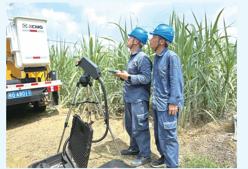
▲作业人员运用激光清障仪切除树枝。

当天上午，作业人员携带激光清障仪抵达现场，调试设备后，将激光焦点对准待切割树枝的关键部位，经过30分钟的精准操作，成功将直径15厘米的超高树枝安全切除，彻底消除隐患。此次技术的