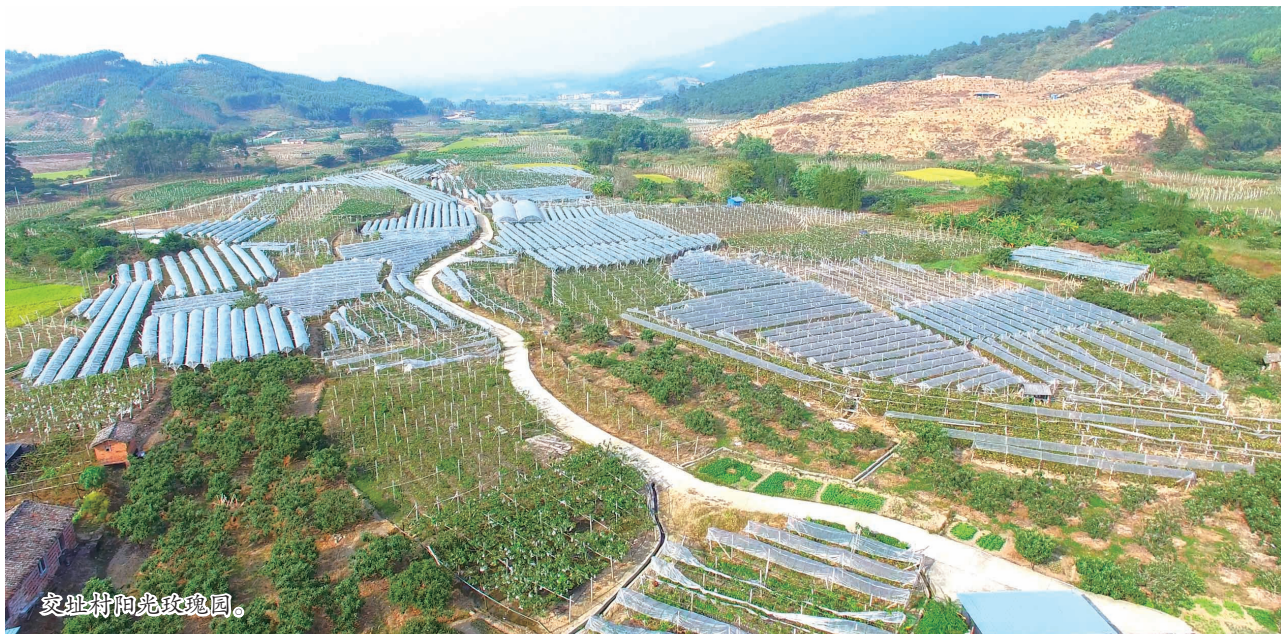
交址屯葡萄种植园。

在象州县寺村镇中团村交址屯，红色基因与绿色产业交织出一幅乡村振兴的生动画卷。这里曾是革命先辈战斗过的地方，也是自治区原主席韦纯束的故乡，如今正以红色文旅为魂、特色产业为骨，走出了一条幸福发展之路。