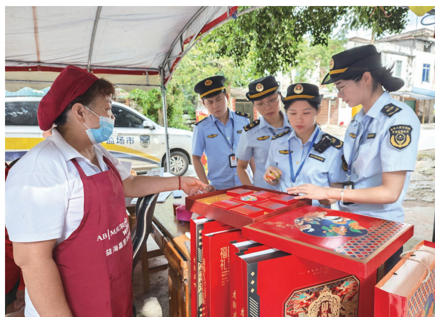
▲中秋佳节将至，月饼进入产销旺季。连日来，合山市市场监管局以辖区内月饼生产企业、小作坊为重点，开展中秋节前月饼生产环节专项检查，从原料到成品实施全链条监管，规范市场秩序，筑牢食品安全防线。图为执法人员对月饼包装、商标进行检查。

今年以来，合山市通过实施“科技兴农”战略，构建“专家团队+科技特派员+示范农户”三级服务体系，围绕澳洲坚果、水稻种植、牛羊养殖等特色产业，采取分组结对、点对点服务方式，开展农学理论培训，深入田间地头指导、示范关键技术，帮助农户掌握科学种养水平，助推农业高质量发展。今年累计开展各类农技服务40余次。（罗姗姗 廖松）