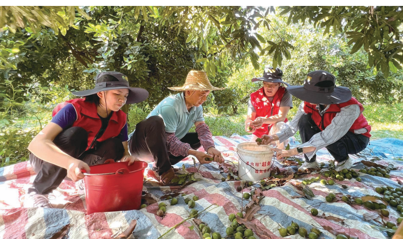
▲农技人员采摘坚果，为测产做准备。

眼下，合山市澳洲坚果陆续进入成熟采收期，一颗颗绿油油、圆溜溜的果实挂满枝头，一派丰收在望的喜人景象。近日，合山市农业农村局和水利局联合各镇农业服务中心、