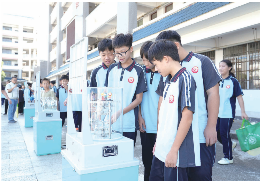
9月17日，以“科技改变生活 创新赢得未来”为主题的首个全国科普月八桂科普大行动象州县活动启动仪式在象州县民族中学举行。现场设置科技表演区、科普展览区和互动交流区，通过机器人演示、科学实验秀、无人机表演以及科技创新成果展、科普知识展板、互动体验装置等形式，将抽象的科学知识转化为直观体验，让师生在互动中感受科学的魅力。图为学生们体验互动装置。