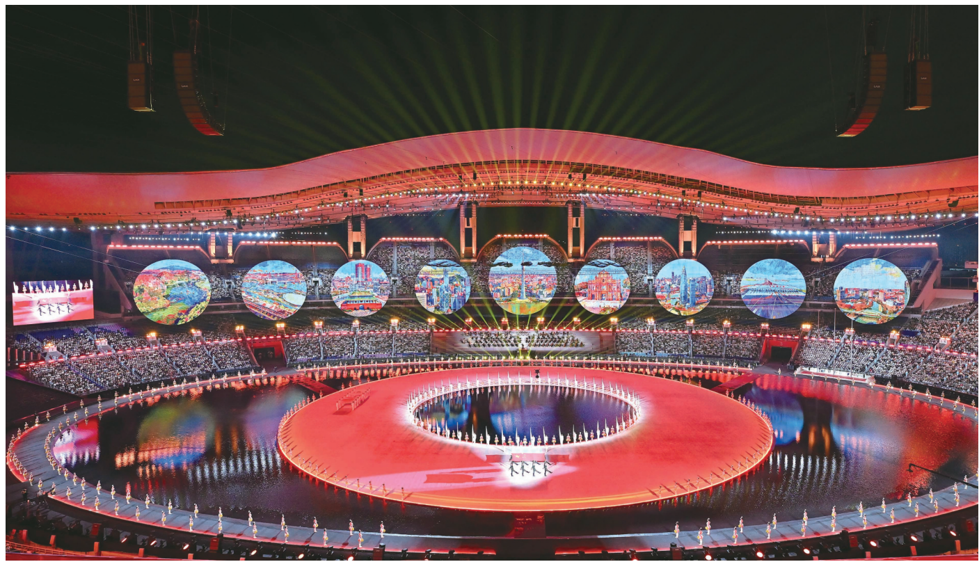
▲这是11月9日拍摄的广东奥林匹克体育中心内景。当日，第十五届全国运动会开幕式在广东奥林匹克体育中心举行。

新华社广州11月9日电 中华人民共和国第十五届全国运动会9日晚在广东省广州市隆重开幕。中共中央总书记、国家主席、中央军委主席习近平出席开幕式并宣布运动会开幕。