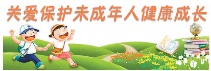
关爱保护未成年人健康成长

广西木偶剧团携「护苗·绿书签」主题剧目走进象州 象州讯 为深入推进“护苗2025”专项行动，强化“绿书签”宣传教育成效，11月13日至14日，广西木偶剧团走进象州县石龙镇，开展“护苗·绿书签”主题木偶情景剧巡演，为当地群众送上一场寓教于乐的文化表演。 此次巡演紧扣《护苗大冒险》这一剧目主题，先后在石龙镇红色文化广场、石龙中心校上演。演出通过活灵活现的木偶形象，巧妙地将抵制盗版书籍、防范校园欺凌、避免网络沉迷等内容融入剧情，以灵活生动的木偶操控、幽默的对话设计、紧凑的情节推进，让观众们在潜移默化中掌握自我保护的方法，现场气氛热烈而欢快。 据悉，此次巡演通过寓教于乐的形式，不仅显著提升当地群众依法维护自身合法权益、抵制不良信息的意识，有效提升大众对“扫黄打非”工作的认识度与参与度，更为青少年健康成长筑牢了文化安全屏障，确保青少年在健康的环境中茁壮成长。(张可儿 赵天然)