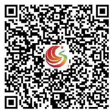
扫码观看相关视频。

从城区的便捷通勤到乡村的平坦小路，从高速的风驰电掣到水运的千帆竞发，来宾的每一条途途都承载着百姓的期盼，通向更美好的未来，这座年轻的城市正以更快速度、更稳的步伐，书写着交通高质量发展的新篇章。