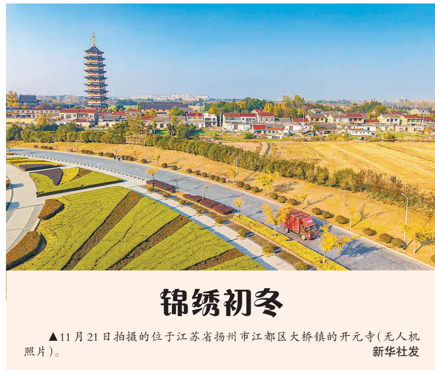
▲11月21日拍摄的位于江苏省扬州市江都区大桥镇的开元寺（无人机照片）。

冲击更高的目标，希望有机会参加洛杉矶奥运会。” 全运练兵，奥运争光。今天全运舞台的佼佼者，可能就是明天奥运赛场的主力军。国家手枪射击队领队杜丽认为，这次全运会的场馆硬件和软件条件都非常优秀，为运动员提供了理想的比赛环境，是他们取得佳绩的重要保障。“比赛中多名年轻选手崭露头角，展现了中国射击可喜的后备力量。比如安徽队14岁的刘子扬，以及2009年出生的河北选手赵桃桃，他们的表现，对于我们洛杉矶（奥运会）的备战来说，是一种鼓舞。” 十五运组委会副主任、国家体育总局副局长佟立新表示，十五运会检验了各省（区、市）长期刻苦训练、不断改革创新训练理念和方法手段、强化科技助力和复合型训练团队建设的成效；从全运看奥运，十五运会达到了检验水平、发现人才、锻炼队伍、奥运练兵的目的，为接下来的奥运会备战打下了基础。 成绩和欣喜之外，全运会也暴露了一些项目存在的问题和差距。佟立新坦承，本届全运会，部分项目没有明显进步，与世界一流水平还有较大差距，一些项目后备人才储备不足，面临新老交替挑战。 基础大项，特别是田径项目，没有明显突破。男子100米冠军得主李泽洋表示，随着苏炳添、谢震业退役，中国短跑短期内想要在国际赛场上有所作为并不现实。“就算我今天全运会拿到了冠军，我的个人最好成绩还不如何德伟、邓信锐、陈冠峰，我必须继续努力。” 杜丽认为，中国射击队虽在个别项目上有突破，但对于奥运备战的标准来说，还有难点，高水平运动员项目分布不够均衡，有些项目只有个别选手突出，未能形成集团优势。 厉兵秣马，时不我待。十五运会让我们看清了自己的家底——有潜力、有希望，也有短板，明确了下一步如何布局，以更清晰的思路“落子”洛杉矶。 （新华社广州11月21日电）