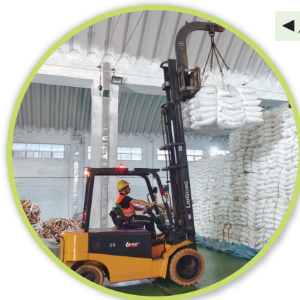
广西博宣公司仓库内工人正在搬运白糖。