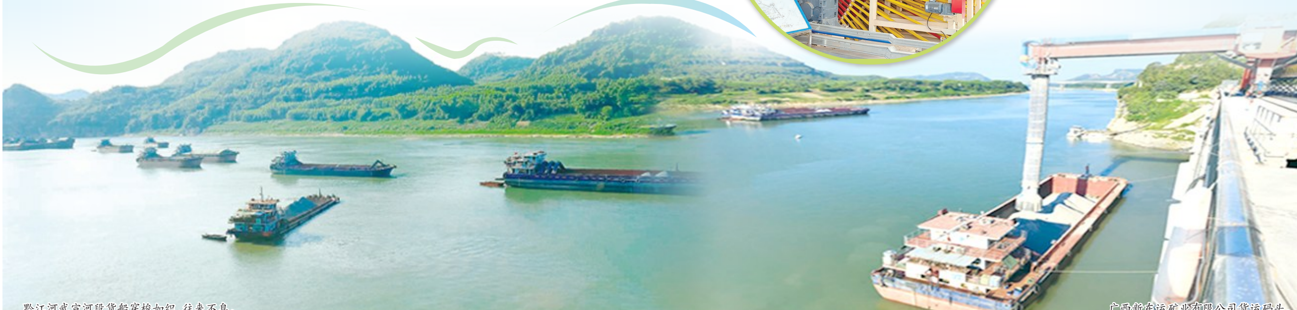
黔江河武宣河段货船穿梭织,往来不息。