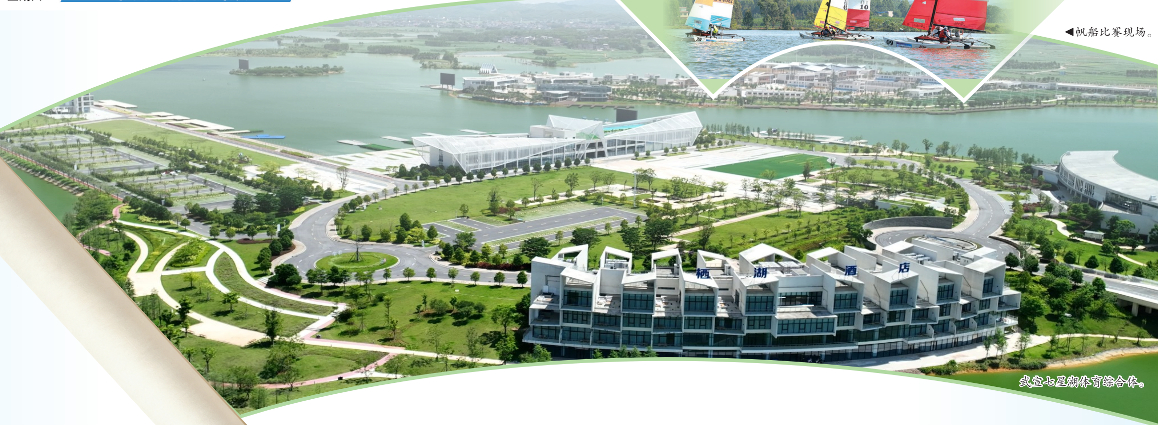
武宣七星湖体育综合体。