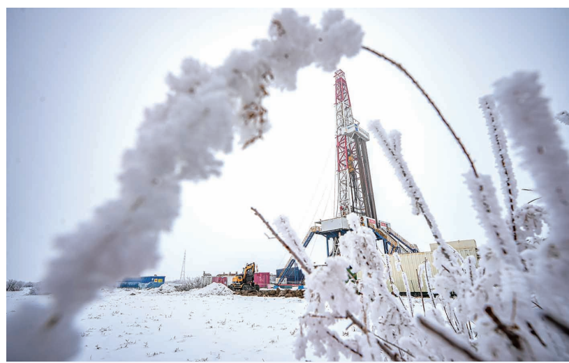
▲这是12月8日在新疆吉木萨尔国家级陆相页岩油示范区中国石油新疆油田页岩油JHW74-33井拍摄的作业现场。中国石油集团12月9日发布消息,我国首个国家级陆相页岩油示范区——新疆吉木萨尔国家级陆相页岩油示范区今年原油产量突破170万吨,标志着其国家级示范工程建设任务全面完成。

潮涌海阔,千帆竞发。琼州海港动能澎湃,助力海南加快构筑连接世界的开放高地。(新华社海口12月9日电)