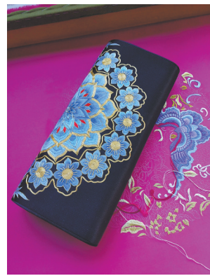
▲金馨设计的“翠色双凤莲花喜相逢”系列纹样。

1935年10月,25岁的费孝通和新婚妻子王同惠,来到了大瑶山的花蓝瑶寨——王桑。他看到随行的挑夫毫不客气地大碗盛着米饭,才知道当地瑶族、汉族群众彼此家里,都可以自由吃饭,不用花钱,“这是民族的礼仪”。