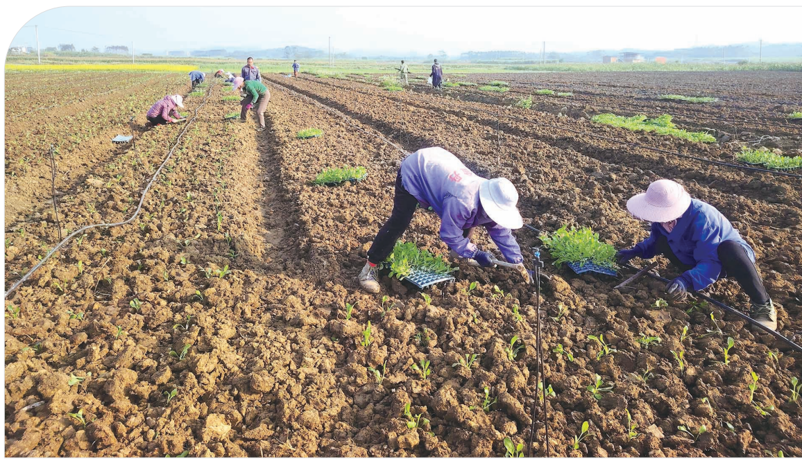
近年来，城厢镇格兰村委中团村推行“合作社+基地+农户”发展模式，大力发展生态蔬菜种植产业，成功打造130多亩生态蔬菜种植基地。眼下40亩白玉米花、莴笋正处于集中种植期，基地蔬菜采取市场批发、订单销售等多元销售模式。图为近日，中团村村民在基地种植白玉米花苗。