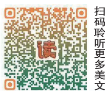
扫码聆听更多美文

时光流转间，来宾的变化日新月异。而我，作为这座城市发展变迁的见证者和记录者，也将继续记录。2026年，与未“来”同行，用手中的笔和镜头，书写更多来宾的精彩篇章。