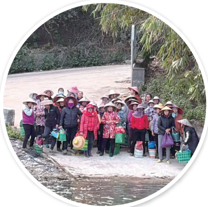
▲蔗工们在等待渡船。

蔗工们在渡口翘首以盼。他们排成八列站着，挤满码头，一眼望去，几乎全是女人。他们头戴斗笠，手挎篮子，篮子里有镰刀、水壶、饭盒。船靠岸，他们蜂拥而上，生怕不能在天黑前赶回家。渡船核载40人，一些人挤不上船，颓然地退回码头，无奈地坐在石头上。