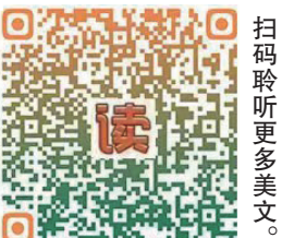
扫码聆听更多美文。

屋檐下堆着一堆泥掌子——有一米多高的直板，有大小适中的“鞋拔子”，有轻便的“小巴掌”，还有个粗短厚重的，大家管它叫“尿壶”。我