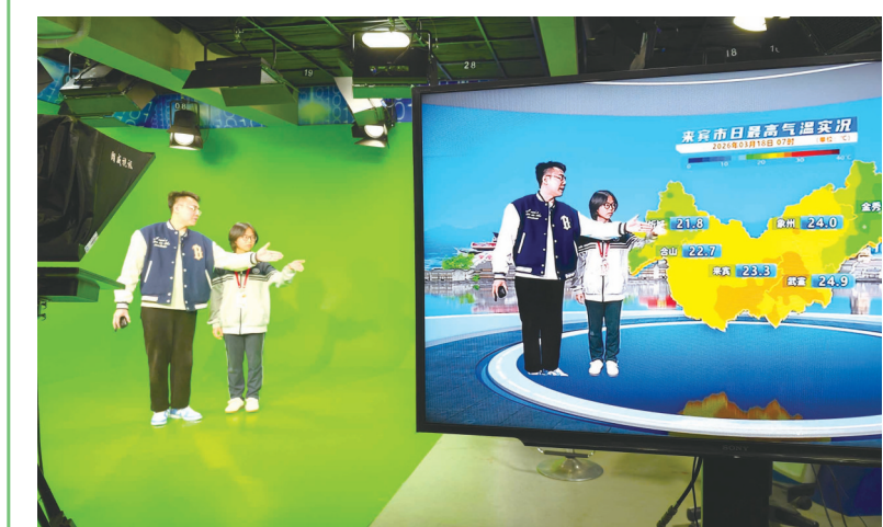
▲学生在体验天气播报。

本报(记者 覃威 见习记者 李婧雯 通讯员 鄧大川 文/图)3月18日，在第66个世界气象日到来之际，市气象局举办“测今日气象 护明日家园”主题开放日活动。来自来宾市第六中学、来宾市实验学校、来宾高级中学的140余名师生走进气象部门，“零距离”了解气象科学工作，在生动有趣的科普体验中加深对气象知识及气候变化的认识。