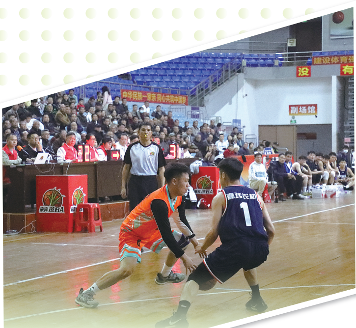
▲比赛精彩瞬间。

两天时间、四场比赛、三地联动，2026年“甜美来宾·蕉BA”县级男子篮球赛以紧凑的赛程、精彩的对抗、热烈的氛围，成为桂中大地上春日里一道亮丽的风景线。本次赛事覆盖各县（市、区）核心场馆，利用周末时间打造群众身边的篮球盛宴，让体育精神走进社区、走进乡村、走进千家万户，让人人参与、人人热爱的篮球热潮持续升温。