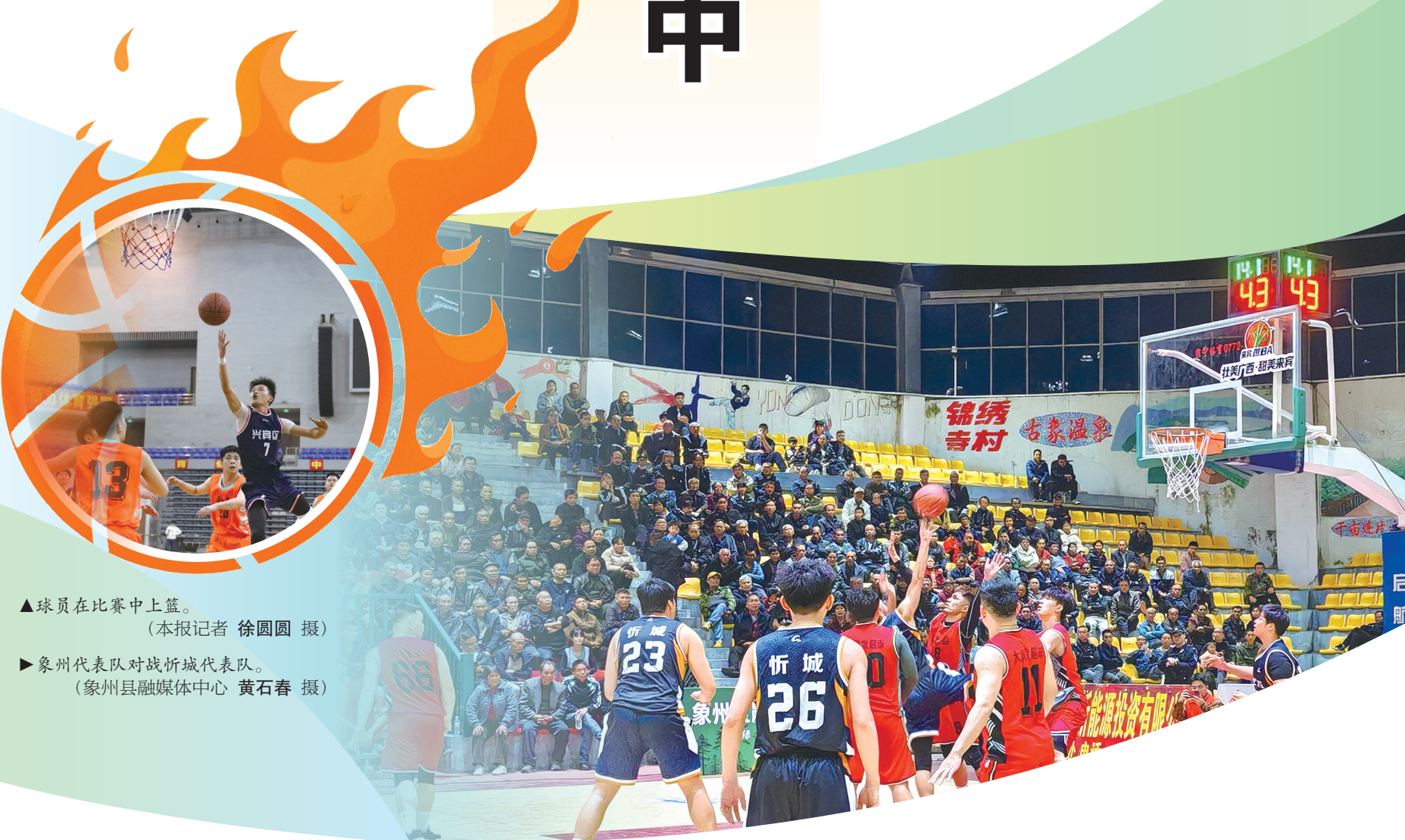
▲球员在比赛中上篮。