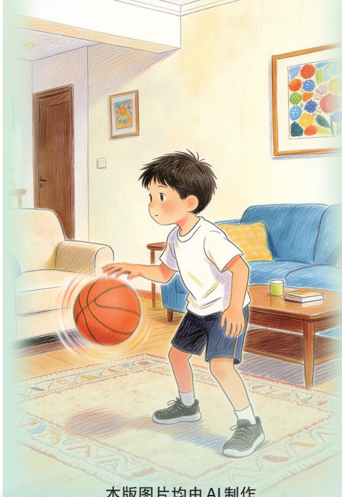
本版图片均由AI制作