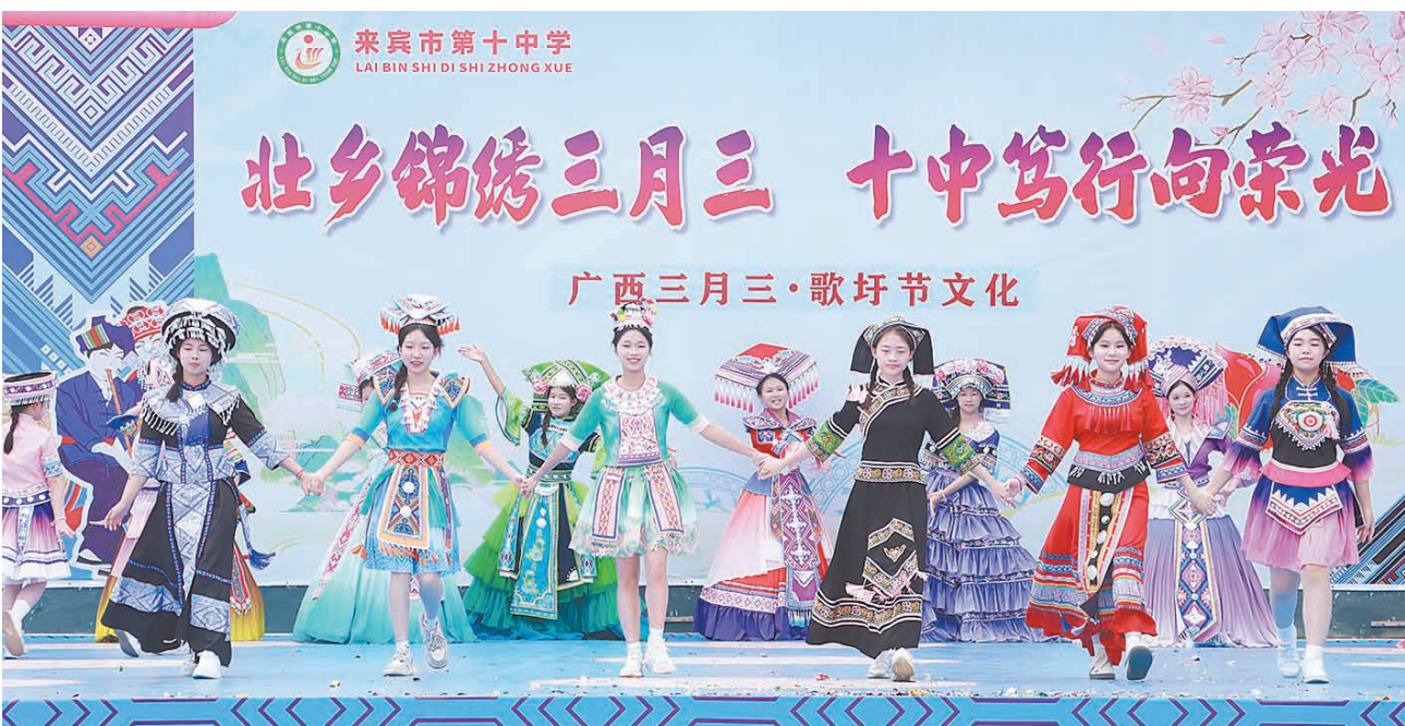
▲4月14日，来宾市第十中学校园内热闹非凡，一场以“壮乡锦绣三月三 十中笃行向荣光”为主题的铸牢中华民族共同体意识民族文化盛宴精彩上演。全校师生与家长代表欢聚一堂，通过文艺展演、民俗体验、美术作品展等形式，共同庆祝广西三月三。

市委全面深化改革委员会，市各改革专项小组组长、副组长及办公室主任，市委政研室(改革办、财经办)班子成员参加会议。