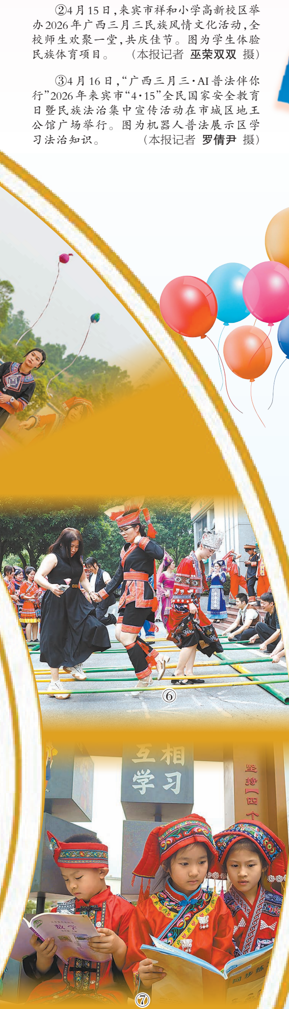
④4月15日下午,广西科技师范学院来宾校区举办2026年中外师生欢度广西三月三文化交流活动,来自中国、越南、泰国、老挝、印度尼西亚、蒙古等国的师生代表齐聚一堂,共赴一场兼具民族韵味与国际温度的文化之约。图为各国学生代表手拉手跳舞。