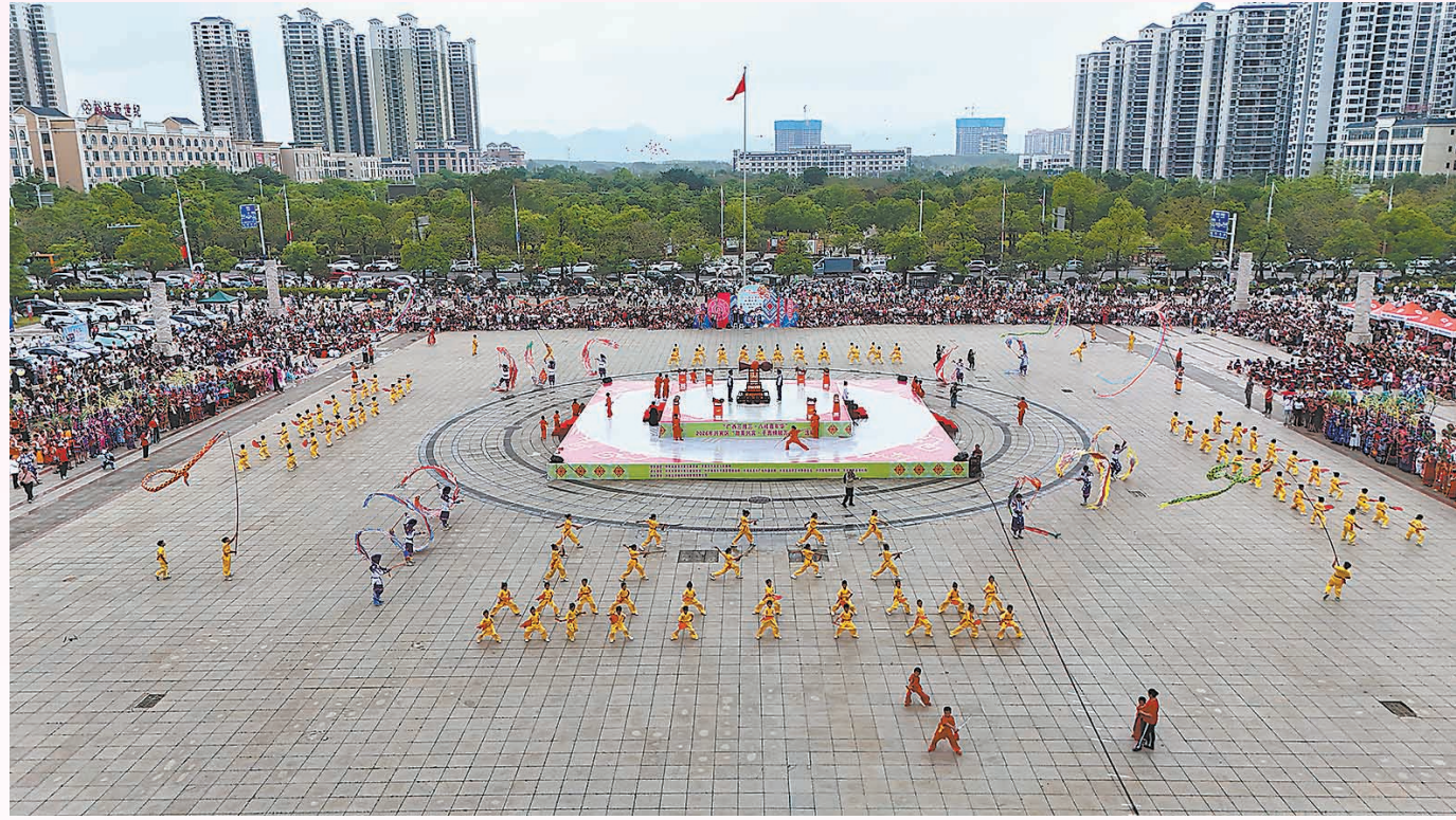
▲4月17日,广西三月三·八桂嘉年华——2026年兴宾区“甜美兴宾·千面蜂鼓万人舞”活动在兴宾区政府大楼广场精彩上演。近万名各族群众齐聚一堂,以壮族蜂鼓文化为核心,通过融合非遗元素剧目人物展示、舞龙舞狮、武术表演、龙飞凤舞、演员互动、群众共舞等形式,共同奏响民族团结与文化传承的动人乐章。图为活动现场。

壮乡盛事,歌海如潮。连日来,我市各地各单位纷纷开展庆祝广西三月三活动。民族盛装、山歌对唱、民俗展演、非遗展示……活动丰富多彩、精彩纷呈,处处洋溢着喜庆祥和的氛围,深厚的文化底蕴与各族群众欢庆佳节的热情相互交融,共同绘就了一幅民族团结、文化繁荣的生动画卷。本报今日推出图片专版,让我们跟随这些生动的光影,共同感受桂中人民最炽热的情与最鲜活的活力。