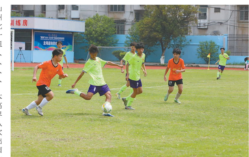
▲来宾六中对阵柳州十二中。

本次小组赛中，来宾市派出2支本土队伍参赛，分别是来宾市第二中学高中男足和来宾市第六中学初中男足。尽管两支队伍未能成功晋级淘汰赛，但队员在赛场上不畏强手、奋勇争先，每一次奔跑、每一次抢断、每一次射门都展现出顽强的拼搏精神，他们的身影成为绿茵场上一道动人的风景，用汗水诠释了体育精神与青春担当。